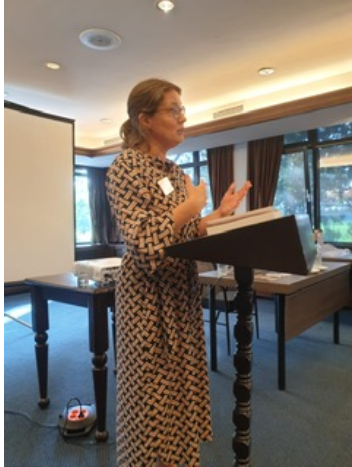
Voorstelling van het boek