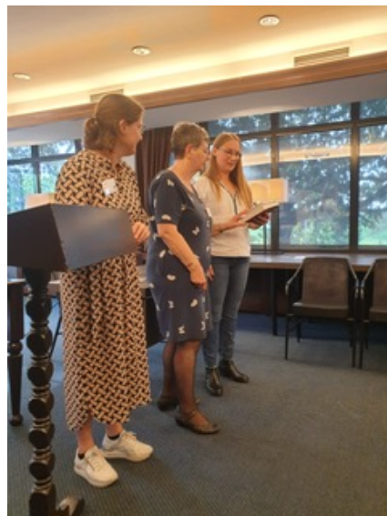
Het eerste boek wordt officieel uitgereikt aan het bestuur