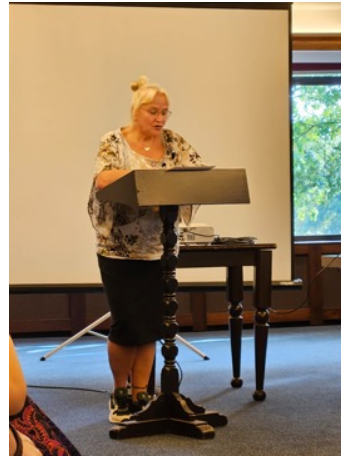
Gedicht wordt voorgelezen